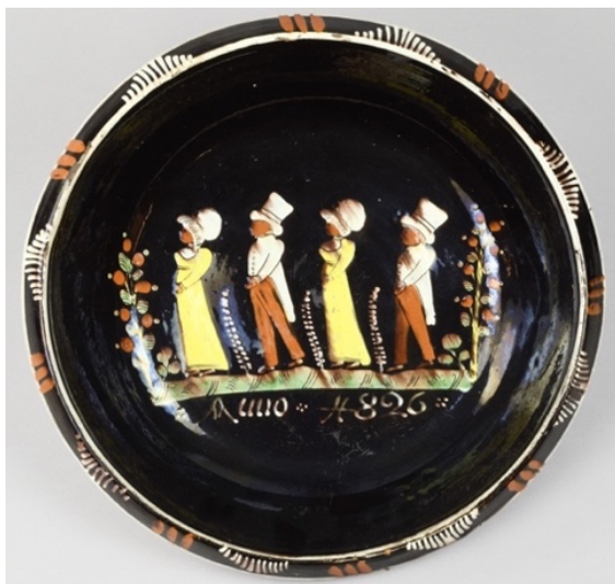
Biedermeier-Stil, Original im Kulturmuseum St. Gallen

Sa., 7. Oktober 2023, Ausstellung Torkel Oberdorf